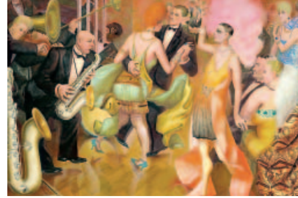
Yanardağ üzerinde dans: Otto Dix Berlin'deki asri yaşamı tuale döktü ("Büyük Şehir", 1927)

Versay ve Saint Germain Barış Antlaşmaları'ndaki birleşme sağlığı büyük Almanya düşüncesinin tekrar kuvvetlenmesine engel olamadı. Bu düşünce, eski imparatorluk fikrinin bir rönesansı ile birleşti: Tam da Almanya askeri olarak yenilmiş ve yenilginin sonuçları altında acı çekmekte olduğundan, geçmişin olduğundan güzel bir şekilde yansıtılmasına inanamaya müsaitti. Ortaçağın Kutsal Roma İmparatorluğu bir ulusal devlet değil, evrensel iddiası olan uluslar üstü bir oluşumdur. 1918'den sonra bu mirasa öncelikle, siyasi sağdaki güçler göndermede bulunuyorlardı. Almanya için yeni bir ileti belirlemişlerdi: Almanya, Avrupa'da düzenleyici güç olarak batı demokrasilerine ve doğu Bolşevikliğine karşı öne çıkmalıdır.