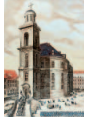
Paul Kilisesi 1848

1848 devriminden birkaç yıl sonra, "gerçekçi siyaset" sözcüğünün politik slogan olması rastlantı değildi: Bu kavramın uluslararası kariyeri, liberal gazeteci Ludwig August von Rochau'nun "Gerçekçi siyasetin temelleri. Almanya'nın resmi durumlarına uygulanmış olarak" başlığı altında yayınladığı bir yazı ile başladı. Aslında Paul Kilisesi, diğer ulusların kendi kaderini tayin hakkını yok saydığına – Polonyalılar'ın Prusya büyük dükalığı Posen'de, Danimarkalılar'ın kuzey Schleswig'de, İtalyanlar'ın Welschtirol'de – ve gelecekteki Alman İmparatorluğu'nun sınırlarını, Almanya'nın farzedilen ulusal çıkarları nereye emrederse oraya kadar çekmeye karar verdiği, tabii ki tamamıyla gerçekçi siyaset uygulamıştı. Böylece birlik, ilk defa özgürlükten daha yüksek bir mertebeye taşınmıştı. Diğer ulusların özgürlüğü henüz Alman Birliği hedefinin arkasında kalmak zorundaydı.