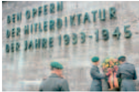
Anımsama kültürü: Federal Alman ordusu askerleri Hitler diktatörlüğünün kurbanlarını anıyorlar

İmparatorluk Parlamentosu, başkanlığa bağlı olağanüstü hal sistemine geçildiğinden beri, yasama organı olarak İmparatorluğun meşruti monarşisinde olduğundan daha az söz hakkına sahipti. Parlamentosuzlaştırma seçmenlerin giderek devre dışı bırakılması demektir ve işte bu, parlamento karşıtı sağ ve sol gurupların güçlenmesine yol açtı. Bundan en fazla nasyonal sosyalistler yararlandı. Sosyal demokratlar Brüning'i düşürdüklerinden beri Hitler kendi hareketini, "Marksizm'in" gerek bolşevik ve gerekse reformist tüm oyun türlerinin halka uygun tek seçeneği olarak tanıtabilmişti. O, şimdi ikisine de çağrıda bulunabilecek durumdaydı: Bu arada gerçekten başarısız olan parlamenter demokrasiye karşı yaygınlaşmış çekinceli tutuma ve erken otuzlu yıllarda Brüning, Papen ve Schleicher hükümetlerinin üçünün de politik etkisini kaybettiği, Bismarck zamanından beri tasdik edilen ve genel eşit seçim hakkı şeklinde vücut bulan halkın katılım hakkına. Böylelikle Hitler, Almanya'nın eş zamanlı olmayan demokratikleşmesinden; yani, demokratik bir seçim hakkının erken başlatılmasından ve hükümet sisteminin parlamenter temele geç kavuşmasından en çok faydalanan kişi oldu.