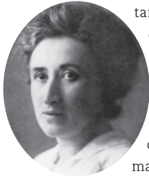
İşçi hareketi savunucusu: Rosa Luxemburg devrim karmaşası sırasında 1919'da Berlin'de öldürüldü

Almanya'nın 28 Haziran 1919'da imzalamak zorunda kaldığı Versay Barış Antlaşması hemen hemen tüm Almanlar tarafından büyük haksızlık olarak algılandı. Bunun nedenleri, Alman İmparatorluğu ve müttefiklerinin savaş suçlusu oldukları gerekçesiyle dayatılan, özellikle yeni kurulan Polonya yararına olan toprak kaybında; tazminat şeklindeki maddi yüklerde; sömürgelerin kaybında ve getirilen askeri sınırlamalarda yatmaktadır. Avusturya'nın Almanya ile birleşmesinin yasaklanması da haksızlık olarak görülüyordu. Habsburg monarşisinin yıkılmasıyla büyük Almanya çözümünün gerçekleştirilmesi için ana engel kalktıktan sonra, Viyana ve Berlin devrim hükümetleri her iki Almanca konuşan cumhuriyetin derhal birleştirilmesine karar vermişlerdi. Bu talebin popülerliğinden her iki taraf da emindi.