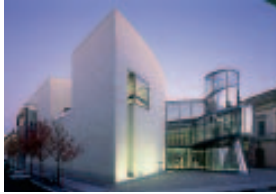
Büyük Koleksiyon: Berlin'deki Alman Tarih Müzesi, Alman tarihiyle ilgili yaklaşık 70 000 esere sahip

Bu tanımlama, iki Almanya'nın birleşmesinin dış politikada güvence altına alınması için her iki Alman Devleti ve İkinci Dünya Savaşı'nın dört galip gücü (Fransa, İngiltere, Sovyetler Birliği ve ABD) arasında, Moskova'da imzalanan, 12 Eylül 1990 tarihli "Almanya ile ilgili olarak kararlaştırılan düzenleme" için kullanılmaktadır. Anlaşma ile Almanya'nın egemenliği yeniden tamamen tanınmış oldu. Alman dış sınırları, Almanya'nın bölge taleplerinden vazgeçmesi koşuluyla kesin olarak tanındı.