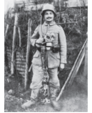
"Verdun Savaşı", 1916: 70000'den fazla Alman ve Fransız yaşamını yitirdi

Tabandan başlayan devrim Kasım 1918'de patlak verdi, çünkü Ekim reformu kağıtta kalmıştı: Askeriyenin büyük kısmı, meclise karşı sorumlu imparatorluk yönetiminin emrine girmeye hazır değildi. Ama, 1918/19 Alman Devrimi, dünya tarihinin büyük ya da klasik devrimleri arasında sayılamaz: 1789 Fransız Devrimi ya da 1917 Rus Ekim Devrimi tarzında olduğu gibi kökten bir siyasi ve toplumsal kırılma için, 1918 dolaylarındaki Almanya fazla "modern" sayılırdı. Ulusal düzeyde yaklaşık yarım yüzyıldır erkeklere genel eşit seçim hakkı tanıyan bir ülkede devrimci bir eğitim diktatörlüğünün oluşturulması değil, ancak daha fazla demokrasi söz konusu olabilirdi. Bunun somut olarak anlamı şudur: Kadınlara seçim hakkının tanınması, tek tek eyalet devletler, kazalar ve belediyelerde seçim hakkının demokratikleştirilmesi, meclise karşı sorumlu hükümetler prensibinin tamamen uygulanması.