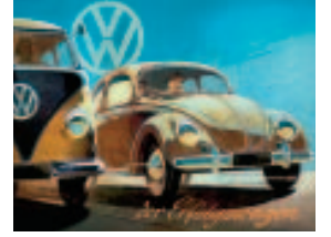
Tekerlekler üzerindeki sembol: Volkswagen kaplumbağa ellili yıllardaki atılımın göstergesi

Weimar Cumhuriyeti'nde, sağ ulusalcı ve sol uluslararasıydı. Federal Almanya'da bu durum başkaydı: İlk Federal Şansölye Konrad Adenauer başkanlığı altındaki ortanın sağı güçleri, Batı'ya bağlanma ve Batı Avrupa'nın uluslararası entegrasyonu politikasını güdüyorlardı. Ölçülü sol sosyal demokrasi, savaş sonrası ilk Başkanları Kurt Schumacher ve onun halefi Erich Ollenhauer yönetimi altında, yeniden birleşmeye Batı'ya entegrasyondan önce üstünlük tanıdıkları vurgulu, ulusal bir profil çiziyorlardı. SPD, 1955 yılında Batı Almanya'nın NATO'ya girmesini sağlamış olan Batı anlaşmaları zeminini ancak 1960 yılında özümsemi. Sosyal demokratlar, Federal Almanya'da iktidar sorumluluğunu almak istiyorlarsa bu adımı atmamak zorundaydılar. Yalnızca Batı anlaşmaları zemininde, 1966 yılında büyük koalisyon hükümetine genç partner olarak girebilir ve üç yıl sonraki, ilk sosyal demokrat Federal Şan-